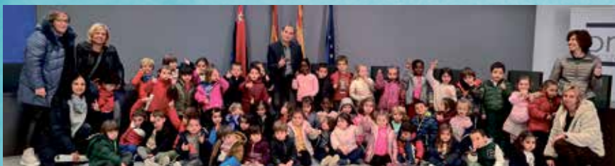
Niños, profesoras y Alfonso Adán, en el salón de actos

Por último, los niños y niñas celebraron un simulacro de pleno con el alcalde, al que trasladaron interesantes preguntas, que finalizó con una foto de recuerdo.