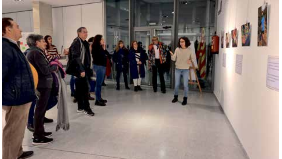
Los asistentes a la inauguración de la muestra contaron con una visita guiada

La exposición fotográfica “Maneras de vivir”, con la que se reivindica que no somos tan diferentes los unos de los otros y no es necesario poner etiquetas, se mostró en la sala de exposiciones de la casa consistorial de Binéfar del 28 de noviembre al 2 de diciembre, con motivo del Día Internacional de las Personas con Discapacidad, que se celebró el 3 de diciembre. Esta exposición estuvo organizada por el Ayuntamiento de Binéfar y un conjunto de asociaciones –englobadas en el colectivo Monzón con la discapacidad 3 de diciembre- que trabajan por y para la discapacidad en la provincia de Huesca, principalmente en las Comarcas del Cinca Medio y La Litera.