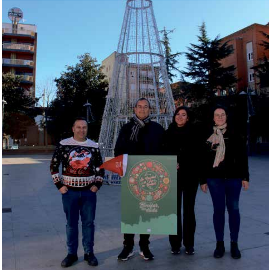
Presentación de la campaña Navidad 2022

El encendido de la iluminación navideña, que este año incorpora nuevas luces led, se llevó a cabo en la plaza de España el pasado 2 de diciembre y permanecerá encendida hasta el 6 de enero. Como novedad este año, además, se modifican los horarios de encendido -en las zonas donde sea posible- para evitar un consumo excesivo de energía, de modo