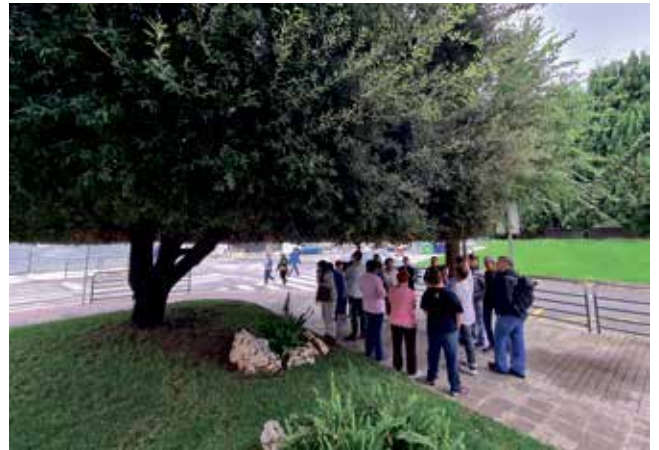
⤴ Visita a la carrasca de la avenida de Aragón

Binéfar se sumó a la Aragón Climate Week 2022 con una actividad ligada a sus árboles singulares. Se ofreció una ruta para mostrar algunos de los ejemplares más destacados, como la que siguieron los usuarios del Centro Ocupacional de Cáritas en Binéfar, que comenzó por la carrasca de la avenida de Aragón (en la foto) y siguió con la visita el chopo negro de la calle Azanuy, las moreras de la estación de ferrocarril y el ciprés de la calle San José de Calasanz, estos tres últimos centenarios.