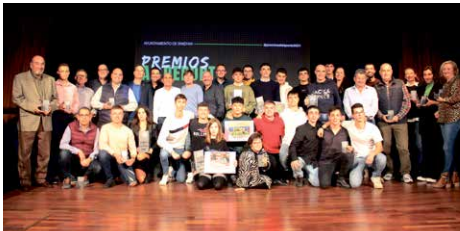
Los premiados posaron juntos con sus galardones

La XX Gala de Premios al Deporte de Binéfar, celebrada el pasado 18 de noviembre en el Teatro Municipal y organizada por el Ayuntamiento de la localidad, premió a deportistas, entidades y personas destacados por sus méritos deportivos durante 2021, así como a José Luis Fondevila, ex futbolista, por su trayectoria vital ligada al deporte. Los premios fueron entregados por el alcalde de Binéfar, Alfonso Adán, y el concejal de Deportes, Juan Carlos García, en un acto donde los deportistas locales, los clubs y las familias fueron los protagonistas.