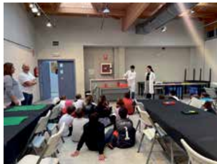
Los escolares disfrutaron con los experimentos y los ‘Matheroes’

Siguiendo la dinámica de las ediciones anteriores, se articuló en tres espacios, atendidos por monitores científicos cada uno de ellos, con