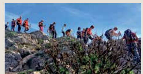
Participantes en una de las tres marchas organizadas en Portet

davía no tenían ese placer, fue toda una experiencia pasar un fin de semana con una gente tan divertida, amable y, sobre todo, tan volcada en que nos sintiéramos lo más cómodos y a gusto posible", concluían desde el Club Litera Montaña. El encuentro incluyó, además de la convivencia, una actividad deportiva con tres rutas senderistas de distintos niveles.