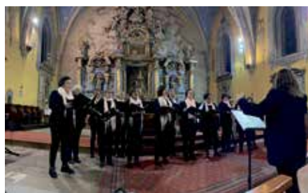
La Coral Versa, en un momento de su actuación en Portet

Encuadrado en los actos de hermanamiento entre Binéfar y Portet, tuvo lugar en este mismo intercambio un concierto musical protagonizado por la Coral Versa de Voces Blancas de Binéfar y el Chœur d'Hommes Passion de Portet, que se desarrolló en la iglesia de San Martín de la localidad francesa. La visita sirvió, igualmente, para fortalecer lazos entre ambas