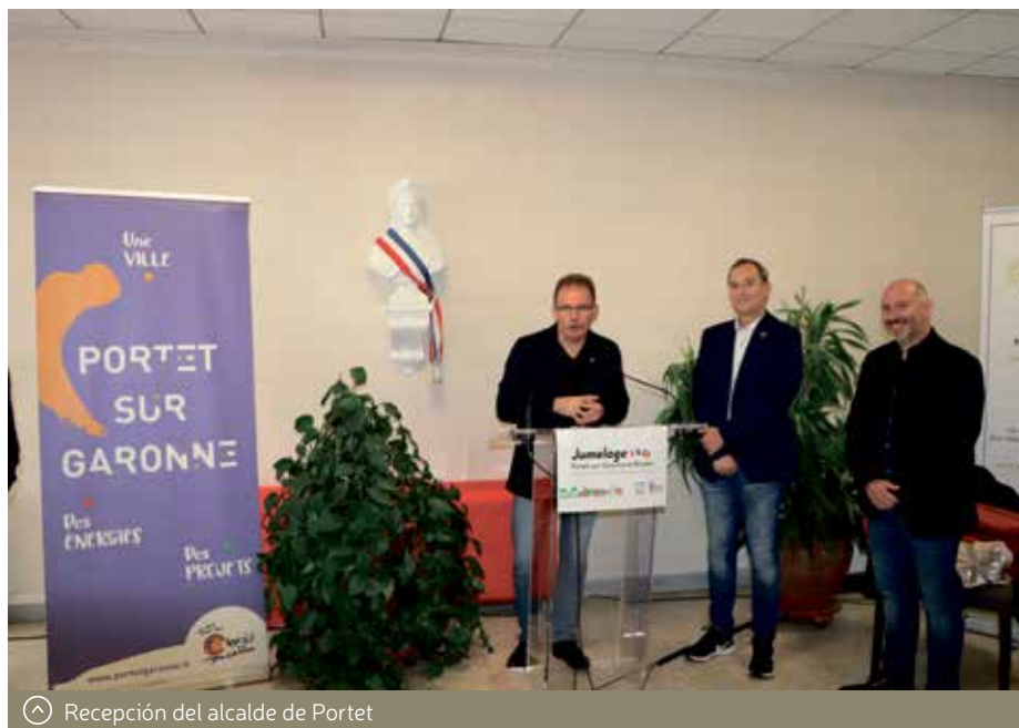
Recepción del alcalde de Portet

El Ayuntamiento de Binéfar, la Coral Versa y el Club Litera Montaña han protagonizado los últimos intercambios con homólogos franceses