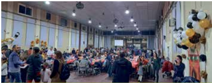
⤴ La fiesta de Nochevieja anticipada del Ampa Víctor Mendoza estuvo muy animada

El Ampa del CEIP Víctor Mendoza, con la colaboración del Ayuntamiento de Binéfar, celebró el pasado 9 de diciembre en el Recinto Ferial una fiesta anticipada de Nochevieja, dirigida en especial a los niños porque no suelen disfrutar de esta celebración pensada para adultos, en la que participaron alrededor de 600 personas. Abierta a todo el público, contó con actuaciones, batucada, animación y grupos de baile, con los que estuvo asegurada la diversión. El Ampa organizó esta velada pensando ante todo en proporcionar una nueva experiencia a los pequeños.