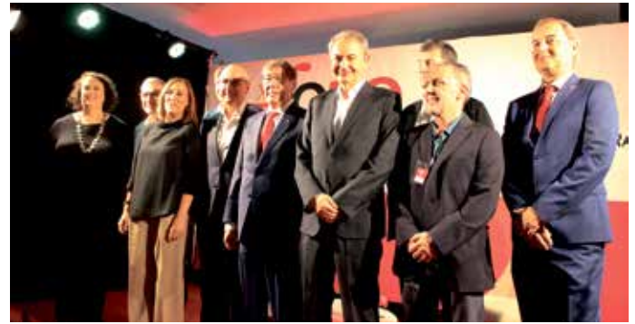
Los ponentes del X Foro Somos Litera