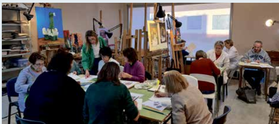
Alumnos del taller de acuarela impartido en el Taller de Artes

Un curso de iniciación a la acuarela, que ha impartido Sheila Hospital en los meses de noviembre y diciembre, ha sido el primer monográfico que se ha ofrecido este año en el Taller de Artes Municipal y con gran éxito de inscritos. Durante cuatro sesiones de dos horas cada una, las alumnas han aprendido las técnicas básicas de la acuarela y han podido ver plasmados sus avances sobre el papel. El Taller de Artes tiene previsto ofrecer nuevos cursos monográficos, además de sus especialidades de manualidades, cerámica, pintura y esmaltes.