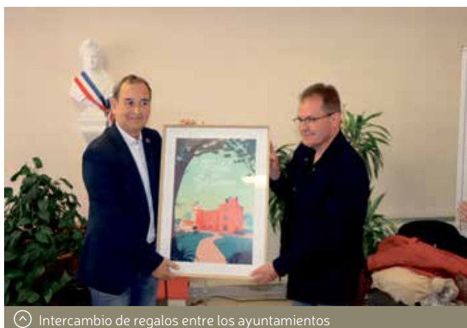
Intercambio de regalos entre los ayuntamientos