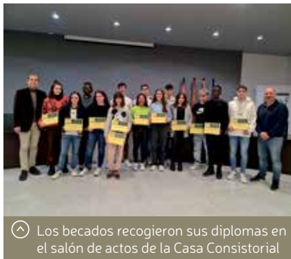
Los becados recogieron sus diplomas en el salón de actos de la Casa Consistorial