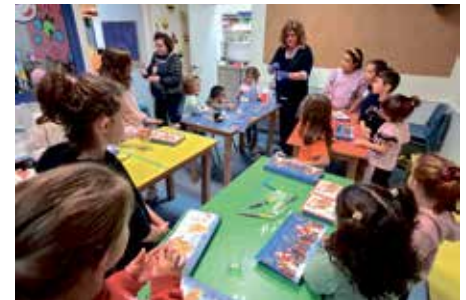
La Ludoteca enseñó a los usuarios a reciclar objetos cotidianos

Además, los usuarios de la Ludoteca Municipal, en la misma línea, trabajaron un taller de reciclado que consistió en convertir una caja de zapatos en un cofre para guardar "tesoros" o fotos, con el que los niños y niñas lo pasaron bien al tiem-