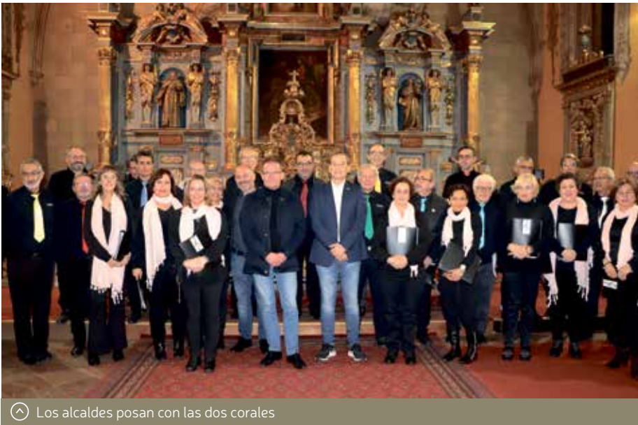
Los alcaldes posan con las dos corales

El encuentro, además, incluyó una reunión de trabajo en la que se establecieron líneas de colaboración entre ambos ayuntamientos, así como próximos intercambios entre colectivos ciudadanos. En este sentido, se prevé que el próximo mes de abril un grupo de alumnos de Secundaria de Portet visiten Binéfar, mientras tanto, se quiere potenciar las conversaciones a través de video conferencia entre alumnos de español y francés de los centros de educación Primaria y Secundaria.