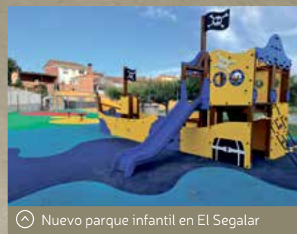
Nuevo parque infantil en El Segalar

Con esta actuación, el Ayuntamiento de Binéfar continúa con los trabajos de remodelación y adecuación a las necesidades actuales de los espacios urbanos municipales dedicados a los niños, como los que se han llevado a cabo en los parques de la calle Me-