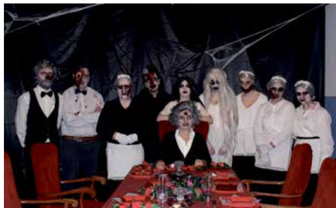
Los voluntarios hicieron posible una nueva celebración de Halloween en el Centro Joven

Como es habitual, la primera hora de apertura del túnel del terror –al que se accedía con invitación previa- estuvo dedicada a niños y niñas de 7 a 10 años y no incluía interpretación. A partir de las 20.00 h y hasta pasada la medianoche, pasaron por la instalación decenas de personas en grupos de diez integrantes a los que los actores aterrorizaban con sustos de diversa índole, divirtiéndose con sus personajes y haciéndolo pasar muy bien a los visitantes.