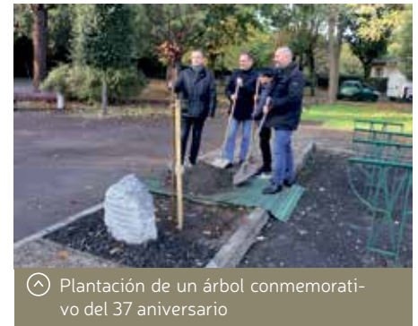
Plantación de un árbol conmemorativo del 37 aniversario

En definitiva, un encuentro en el que se refuerzan lazos entre ambas localidades hermanadas y en el que se establecen líneas de intercambio para llegar al máximo de estratos sociales y económicos en beneficio de todos y con la vista puesta en el futuro de las nuevas generaciones.