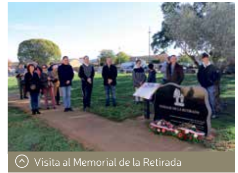
Visita al Memorial de la Retirada

Entre los proyectos municipales, se trabajará en la participación del Ayuntamiento de Binéfar en la Feria Natura de Portet, que se celebra en el mes de junio. Asimismo, se potenciarán los lazos entre los espacios coworking de ambas localidades y se generará un porfolio empresarial y comercial para intercambiarlo entre ayuntamientos, con la colaboración de las respectivas asociaciones de empresarios y comercio con el objetivo de generar sinergias.