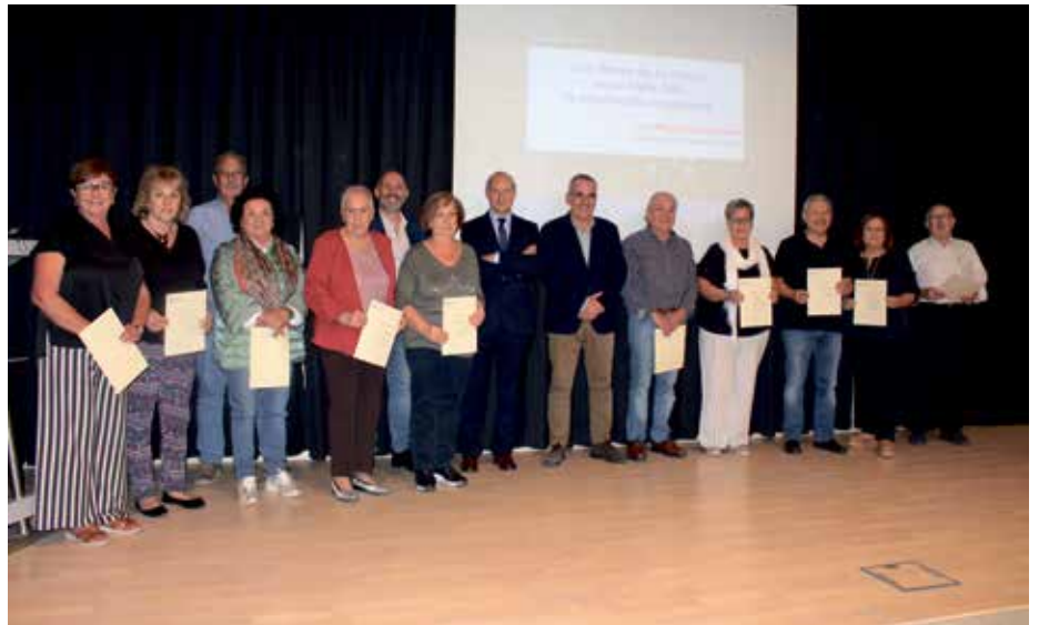
Grupo de alumnos que recogieron sus diplomas este año

dirigió a los alumnos para darles la enhorabuena por ser “la sede, después de Zaragoza, con más éxito por el número de alumnos, que cada año va a más, lo