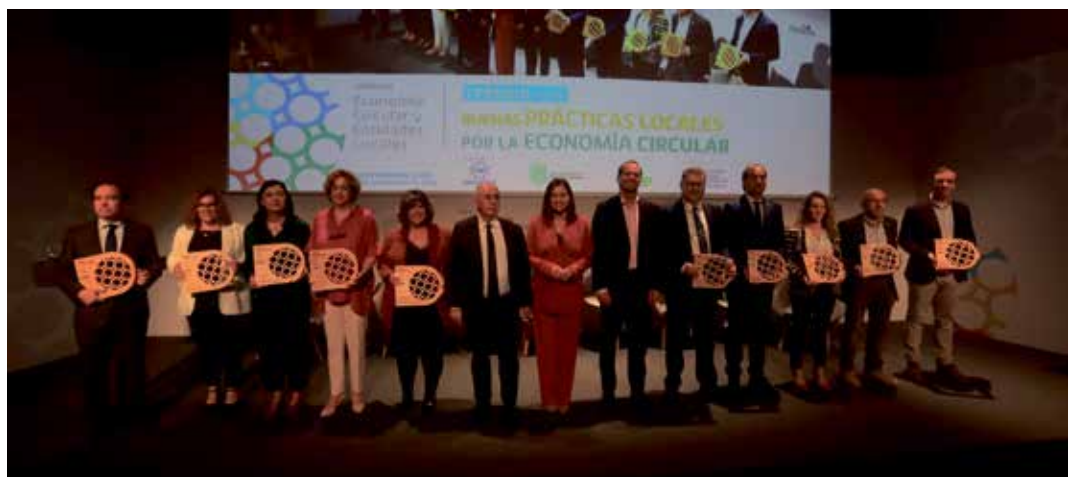
Los premiados en el acto de entrega de galardones