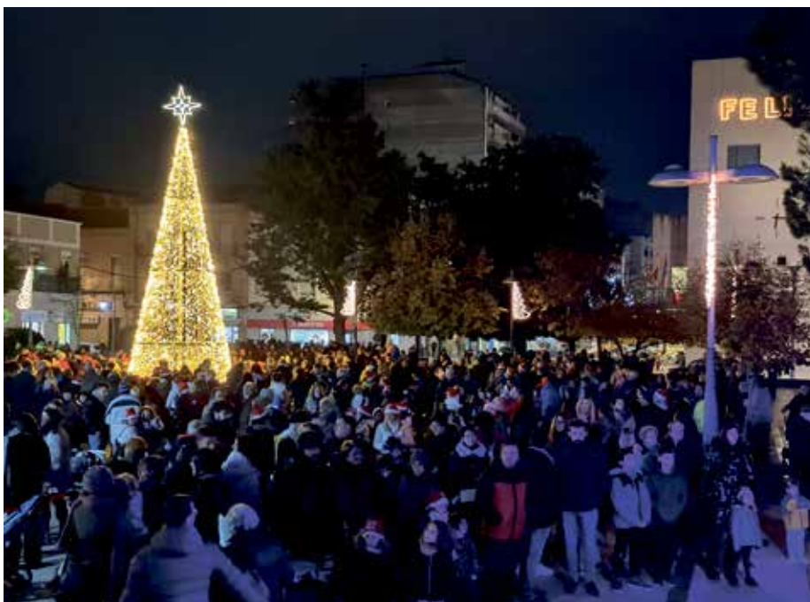
Multitudinario encendido de luces en la plaza de España

que desde el 2 hasta el 23 de diciembre, el alumbrado navideño estará encendido desde las 18.00 hasta las 23.00 h. Mientras que los días 23, 24, 25, 30 y 31 de diciembre, y 1, 5 y 6 de enero, el horario será de 18.00 a 1.00 h, tal como explicó Alfonso Adán.